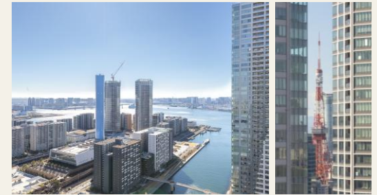
※リビングからの眺望